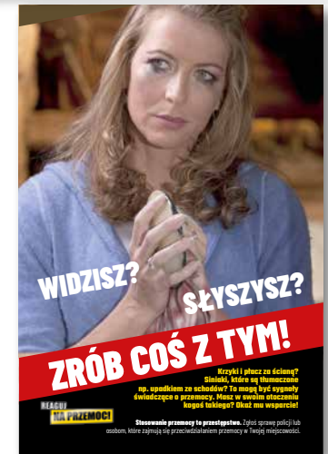
Widzisz? Słyszysz? Zrób coś z tym! Plakat, format B2