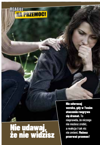
Nie udawaj, że nie widzisz Ulotka dla ofiar, format A4 złożone do A5