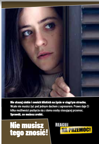
Nie musisz tego zność! Ulotka dla ofiar, format A4 złożone do A5