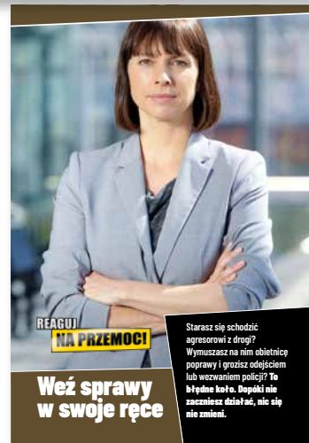
Weź sprawy w swoje ręce Ulotka dla ofiar, format A4 złożone do A5