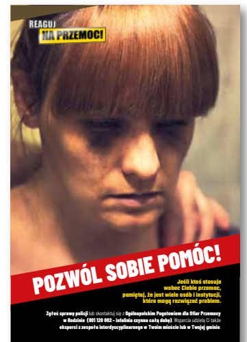
Pozwól sobie pomóc Plakat, format B2

Przystępując do kampanii, gmina realizuje zadania wynikające z dwóch ustaw: