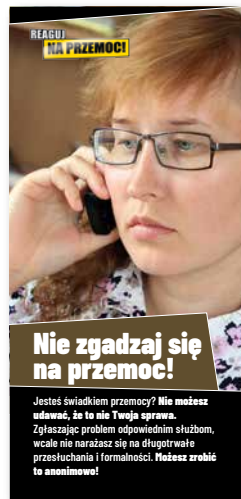
Nie zgadzaj się na przemoc! Ulotka dla świadków, format 2/3 A4 złożone na pół