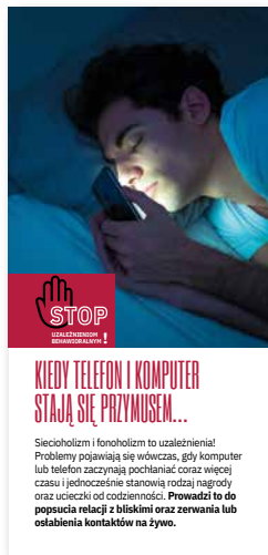
Kiedy telefon i komputer stają się przymusem. Ulotka, format 2/3 A4 złożone na pół