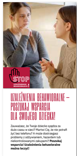
Uzależnienia behawioralne - poszukaj wsparcia dla swojego dziecka. Ulotka, format 1/3 A4