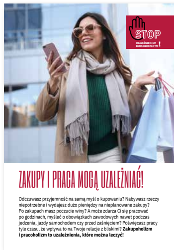
Zakupy i praca mogą uzależniać. Ulotka, format A4 złożone do A5