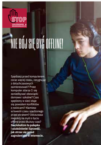
Nie bój się być offline! Ulotka, format A4 złożone do A5