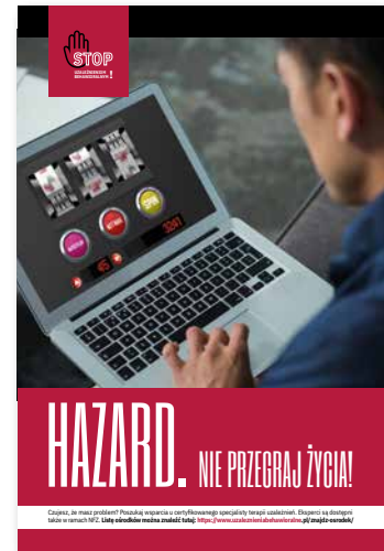
Hazard. Nie przegraj życia! Plakat, format B2