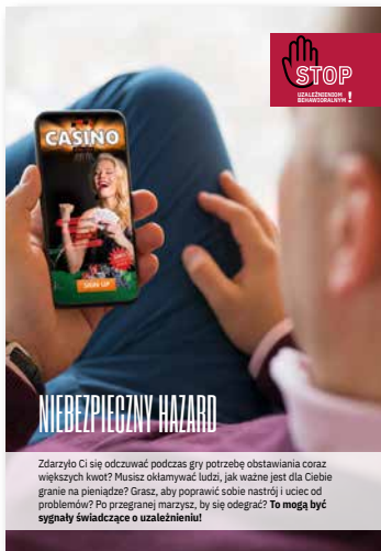
Niebezpieczny hazard. Ulotka, format A4 złożone do A5