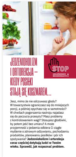
Jedzenioholizm i ortoreksja - kiedy posiłki stają się koszmarem. Ulotka, format 2/3 A4 złożone na pół