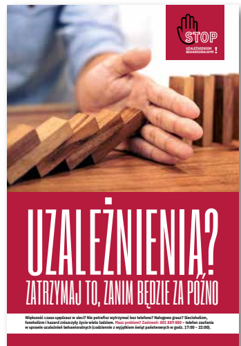
Uzależnienia? Zatrzymaj to, zanim będzie za późno! Plakat, format B2

Warto pamiętać, że ustawa z dnia 17 grudnia 2021 r. o zmianie ustawy o zdrowiu publicznym nakłada na samorządy obowiązek uwzględnienia w gminnych programach profilaktyki kwestii związanych z uzależnieniami behawioralnymi.