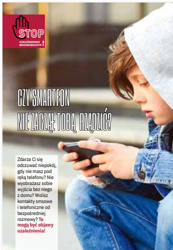
Czy smartfon nie zaczął Tobą rządzić? Ulotka, format A4 złożone do A5