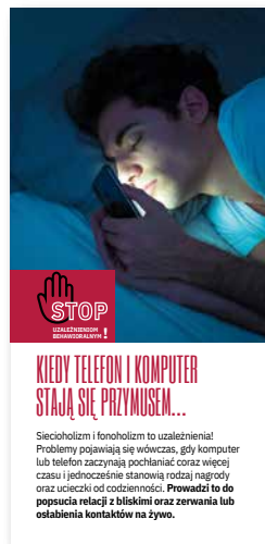
Kiedy telefon i komputer stają się przymusem. Ulotka, format 2/3 A4 złożone na pół