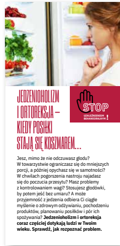
Jedzenioholizm i ortoreksja - kiedy posiłki stają się koszmarem. Ulotka, format 2/3 A4 złożone na pół