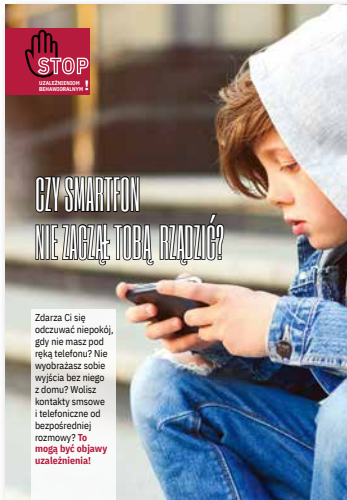
Czy smartfon nie zaczął Tobą rządzić? Ulotka, format A4 złożone do A5