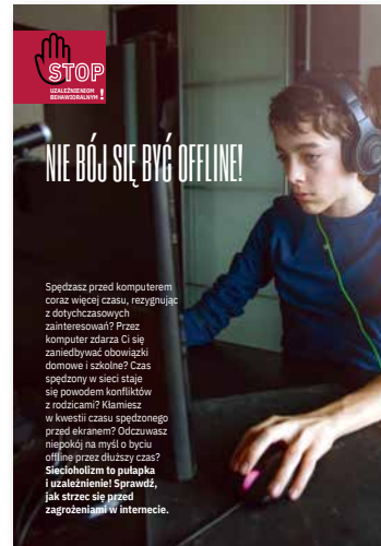
Nie bój się być offline! Ulotka, format A4 złożone do A5