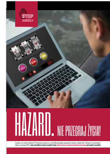
Hazard. Nie przegrzaj życia! Plakat, format B2