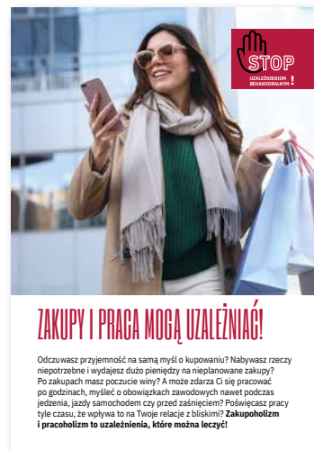
Zakupy i praca mogą uzależniać. Ulotka, format A4 złożone do A5