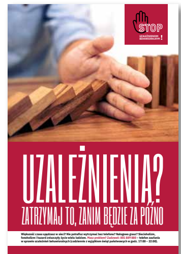
Uzależnienia? Zatrzymaj to, zanim będzie za późno! Plakat, format B2

Warto pamiętać, że ustawa z dnia 17 grudnia 2021 r. o zmianie ustawy o zdrowiu publicznym nakłada na samorządy obowiązek uwzględnienia w gminnych programach profilaktyki kwestii związanych z uzależnieniami behawioralnymi.