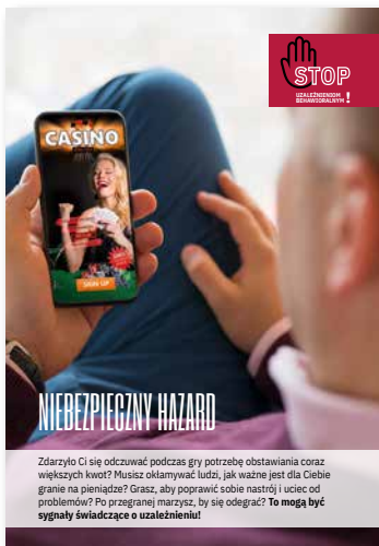
Niebezpieczny hazard. Ulotka, format A4 złożone do A5