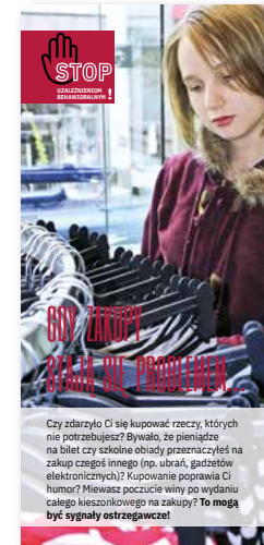
Gdy zakupy stają się problemem. Ulotka, format 1/3 A4