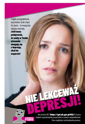
Nie lekceważ depresji! Plakat, format B2