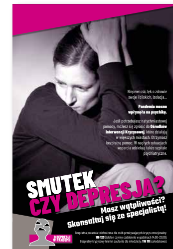
Smutek czy depresja? Masz wątpliwości? Skontaktuj się ze specjalistą! Plakat, format B2