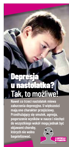
Depresja u nastolatka? Tak, to możliwe! Ulotka, format 1/3 A4