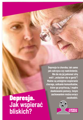
Depresja. Jak wspierać bliskich? Ulotka, format A4 złożone do A5