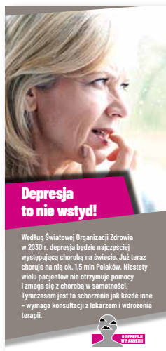
Depresja to nie wstyd! Ulotka, format 2/3 A4 złożone na pół