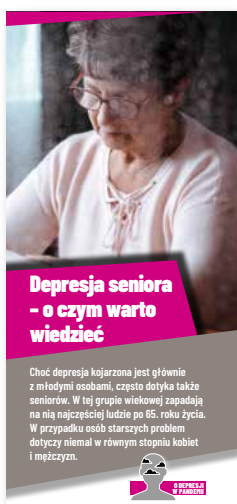
Depresja seniora - o czym warto wiedzieć Ulotka, format 2/3 A4 złożone na pół