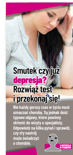
Smutek czy już depresja? Rozwiąż test i przekonaj się! Ulotka, format 1/3 A4