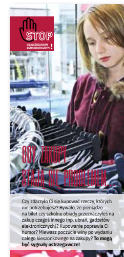
Gdy zakupy stają się problemem... Ulotka, format 1/3 A4