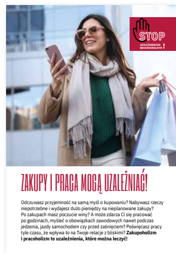
Zakupy i praca mogą uzależniać! Ulotka, format A4 złożone do A5