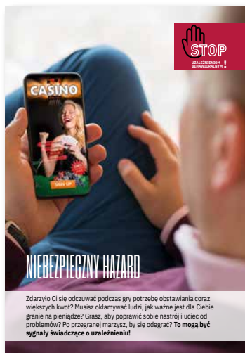
Niebezpieczny hazard Ulotka, format A4 złożone do A5