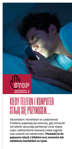
Kiedy telefon i komputer stają się przymusem... Ulotka, format 2/3 A4 złożone na pół