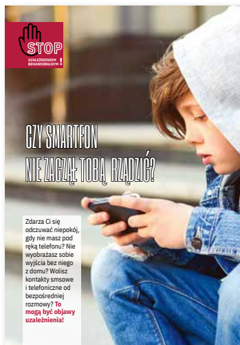
Czy smartfon nie zaczął Tobą rządzić? Ulotka, format A4 złożone do A5