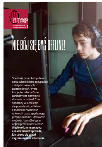
Nie bój się być offline! Ulotka, format A4 złożone do A5