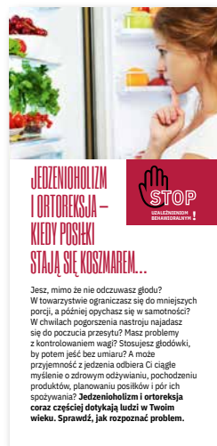
Jedzenioholizm i ortoreksja – kiedy posiłki stają się koszmarem... Ulotka, format 2/3 A4 złożone na pół