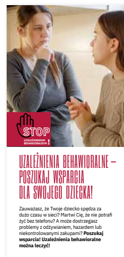
Uzależnienia behawioralne – poszukaj wsparcia dla swojego dziecka! Ulotka, format 1/3 A4