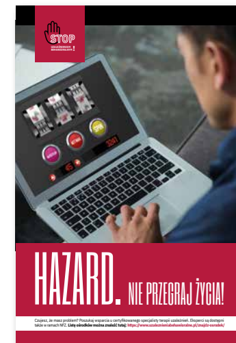
Hazard. Nie przegram życia! Plakat, format B2