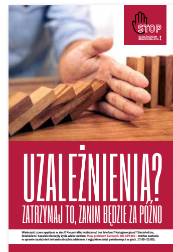
Uzależnienia? Zatrzymaj to, zanim będzie za późno Plakat, format B2

Przystępując do kampanii, samorząd realizuje zadanie z art. 4 1 ust. 1 pkt 3 ustawy o wychowaniu w trzeźwości i przeciwdziałaniu alkoholizmowi.