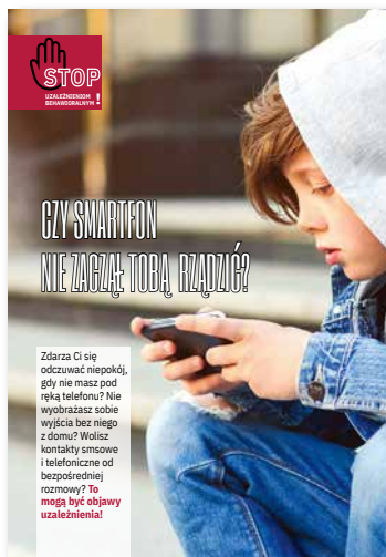
Czy smartfon nie zaczął Tobą rządzić? Ulotka, format A4 złożone do A5