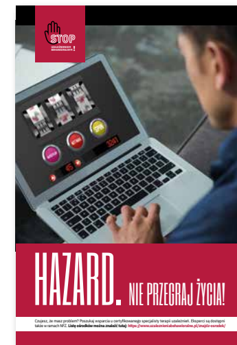
Hazard. Nie przegram życia! Plakat, format B2