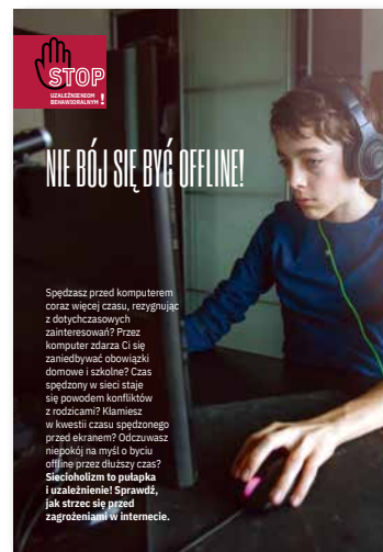
Nie bój się być offline! Ulotka, format A4 złożone do A5